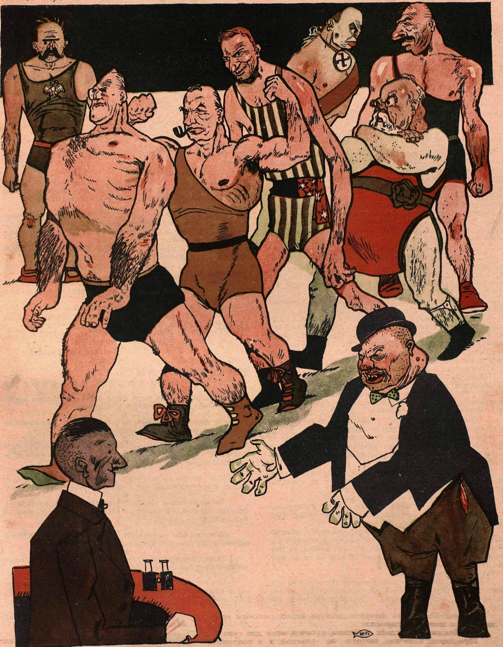
Рис. Ю. Ганфа

— Чемпионы Англии—Чемберлен и Болдуин! Чемпион Америки — Кулидж! Чемпион Франки — Пуанкаре! Чемпион Испании — Примо де Ривера! Чемпион Италии—Муссолини! Чемпион Польши—Пилсудский! — Скажите, а нет ли у вас чемпиона мира? — Извиняюсь! В нашем чемпионате участвуют только чемпионы войны!!!