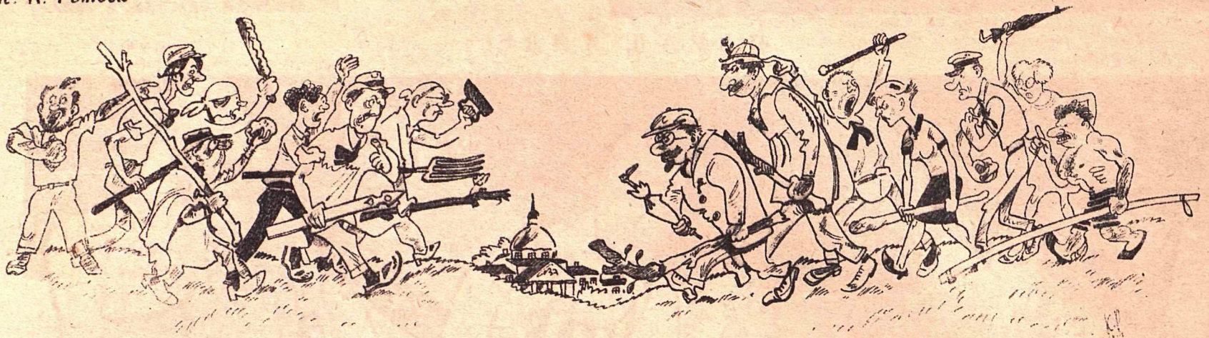
Экскурсия... на экскурсию!