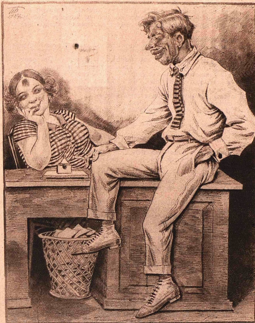
Рис. Белянина (Свердловск)

— В америке мужчины каждый день носки меняют!