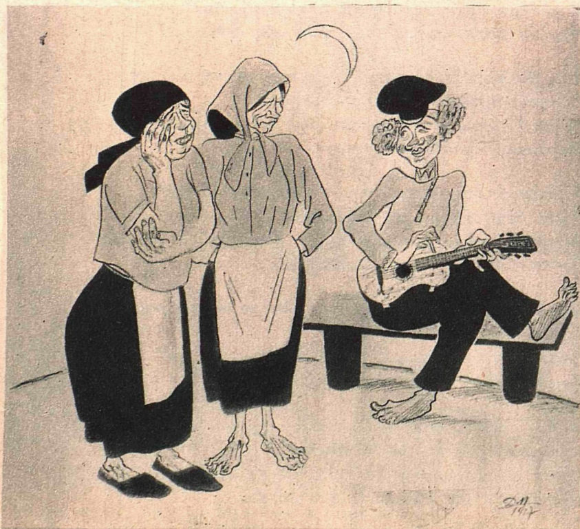
Рис. Д. Мельникова по конкурсной теме Филиппова