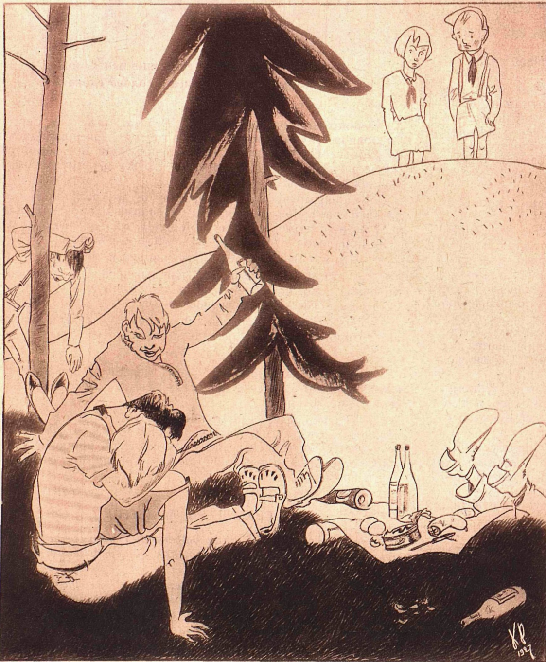
Рис. К. Ротова по конкурсной теме Корговика Ян.