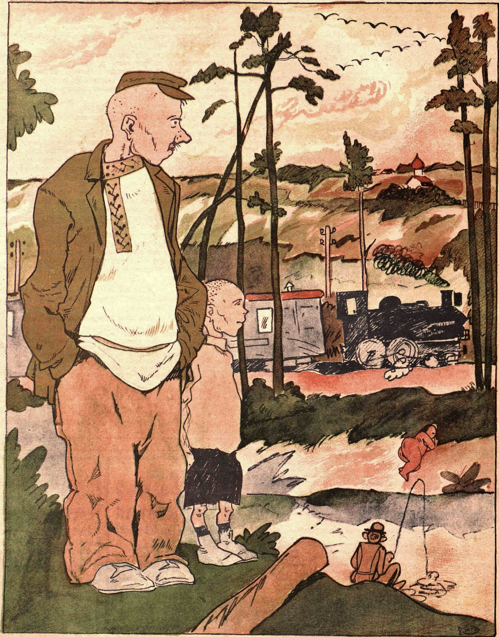
Рис. Ю. Ганфа

— Папа, все птицы осенью на юг перебираются? — Нет, сынок, только важные!