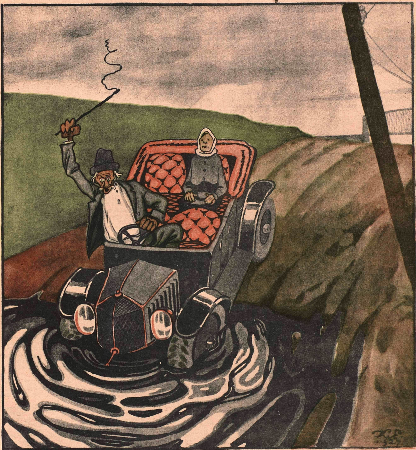
Рис. К. Елисеева